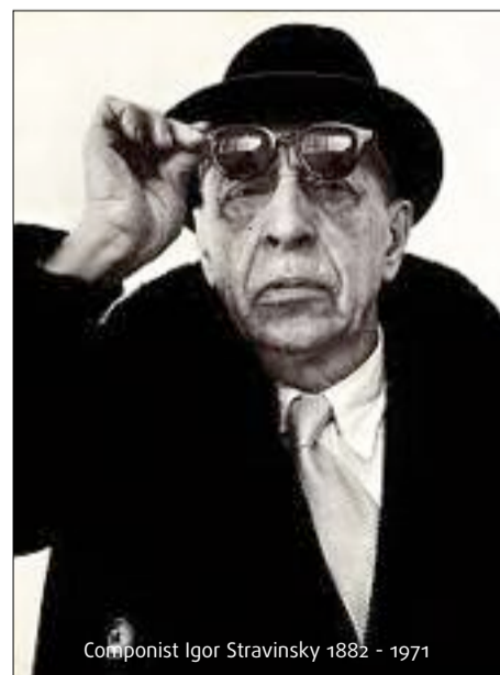
Componist Igor Stravinsky 1882 - 1971

Er zijn talloze uitvoeringen en interpretaties van dit beroemde ballet. Ook Dario Fo waagt zich aan dit ballet. Het centrale thema in de Sacre is het brengen van een offer. In onze uitvoering gaat het over de offers die een vrouw moet brengen. Over het verliezen van onbevangingheid en frisheid van de jeugd. Over de onzekerheid van de veranderingen naar volwassenheid. Over het verloren gaan van een jong krachtig lichaam. Over het verdragen van de onvoorstelbare kracht van het krijgen van een kind. Over het loslaten van je kinderen. Over verandering en verlies van vruchtbaarheid. Over het verdriet van verlies.