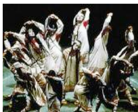
Uitvoering van Le Sacre van Joffrey Ballet's in 1987 in de originele setting, kostuums en choreografie uit 1913.