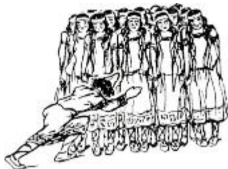
Illustratie van de eerste uitvoering van Stravinsky's Le Sacre du Printemps in 1913.

Een beroemd ballet. Een baanbrekend ballet. Een vernieuwend ballet. Een veelvuldig uitgevoerd ballet. Een ballet met een geschiedenis. Een ballet met toekomst. Een ballet over een offer brengen. Een ballet voor Dario Fo? Ja, met 100 vrouwen in de leeftijd van 7 tot 77 jaar.